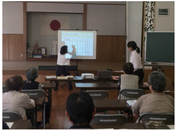
写真4 還付金詐欺の疑似体験②