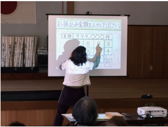
写真3 還付金詐欺の疑似体験①