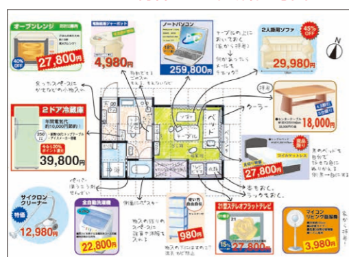
ワーク6 <物件C> 完成参考図